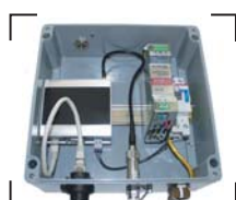
Solution WiFi industrielle